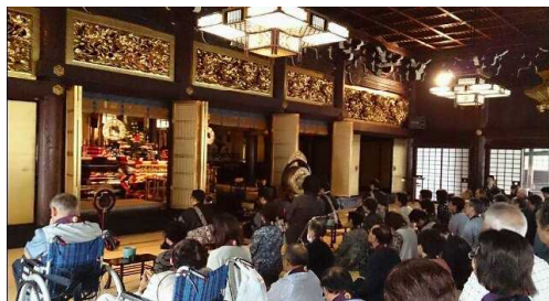
大谷本廟参拝・法要